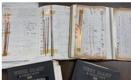
加工の知見が詰まっている加工ノート