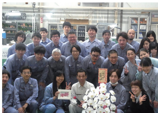
日々技術を磨き上げている当社の社員